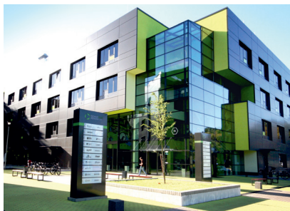
Parco Tecnologico Pomerania. Park Naukowo-Technologiczny Szczecin/ PL

STRUTTURE HST E FACCIATE dagli elevati parametri di protezione termica, acustica e contro il vento.