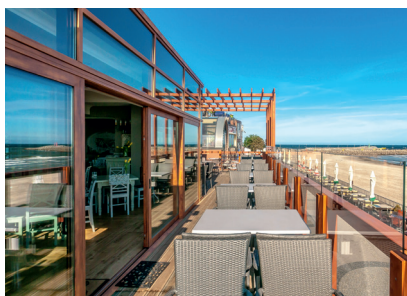
Ristorante sul lungo mare. Kołobrzeg/ PL