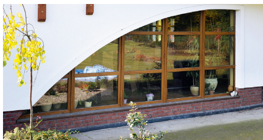
Villa unifamiliare Poznań