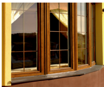
Villa unifamiliare Poznań