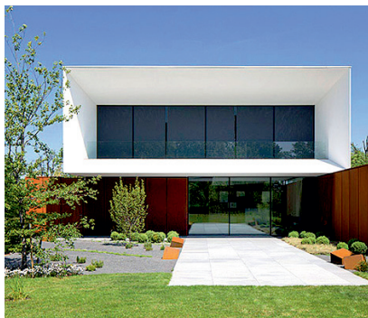
Casa vacanza. Lubin/ PL