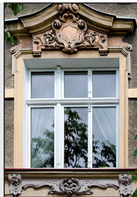
Studio legale Stettino