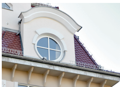
Hotel presso una località marittima. Świnoujście/ PL