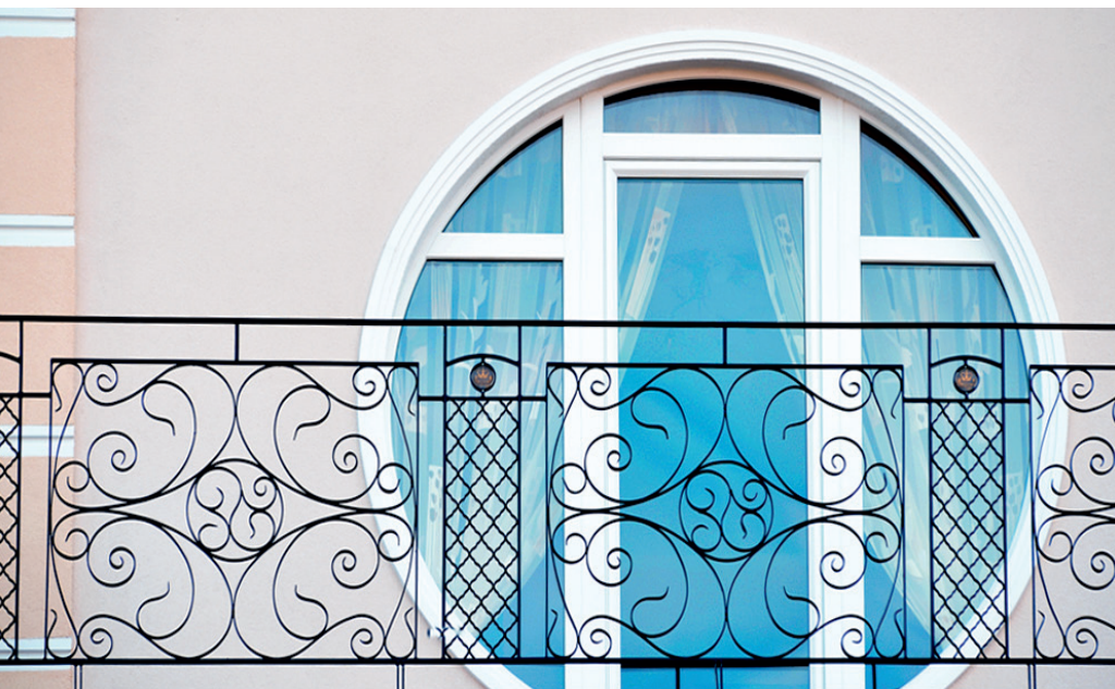
Bed & breakfast Świnoujście

ADATTAMENTO AL 100% ALLE ESIGENZE DEL MERCATO LOCALE