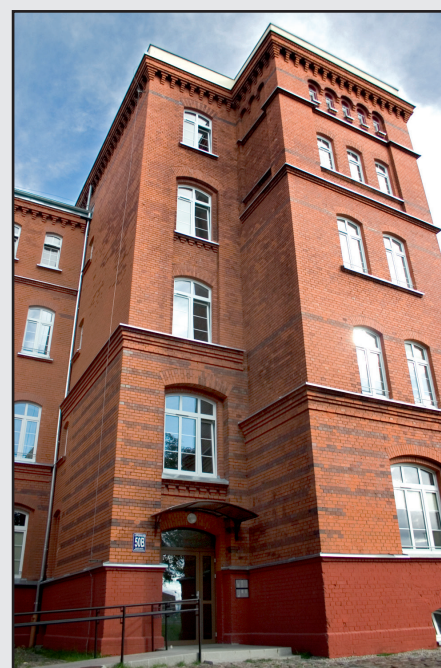
Quartiere residenziale Kołobrzeg