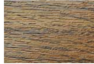
2156.003 dąb rustykalny