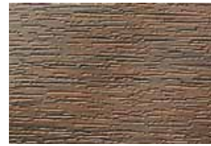
2052.089 dqb bagienny