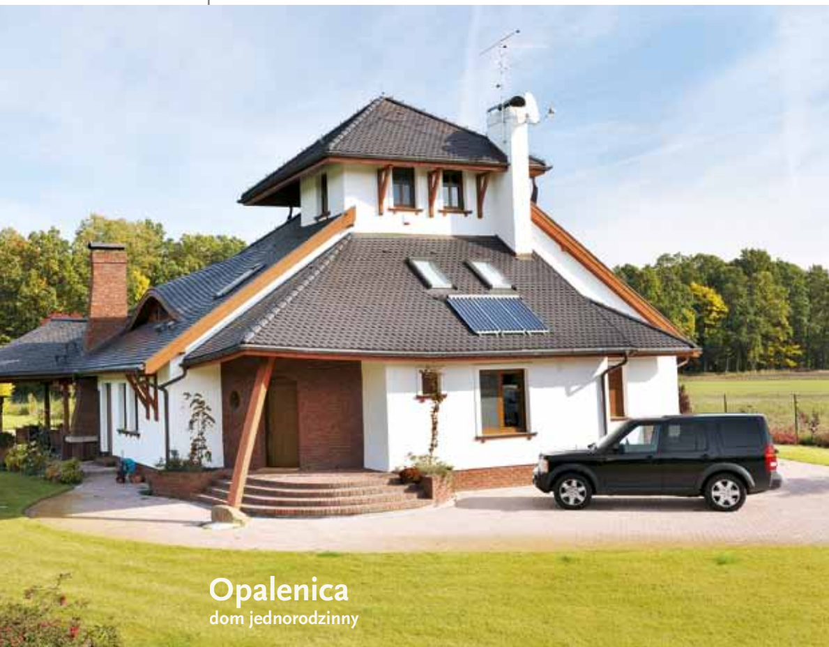
Opalenica dom jednorodzinny