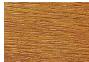
2178.001 dąb złoty